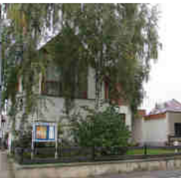
Ev. - Freikirchliche Gemeinde