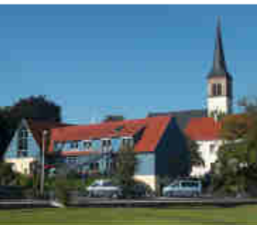
Ev. -Luth. Gemeinde