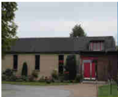
Röm. - Katholische Gemeinde